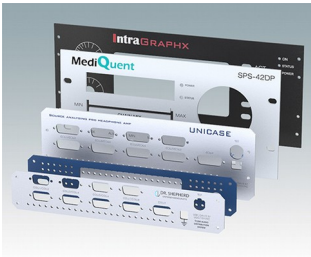
M0000410 Kundenspezifische Frontplatten Aluminium

Technische Änderungen vorbehalten.